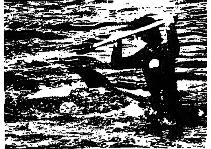
مركبة فوق الماء .. والضحية دولفين

اليابانيين ، العملية وهندسهم العالم اجمع واطلق اليابانيون صييد الذي يمثل هذا الواقع «اليابان الموحدة ضد العالم» . نانايا ، مستشار وكالة صيد وطنية صرح قاتلا انه من نانايا عدم قتل الدلافين . ان يابانيين يشتمون بالقضب ضد العالم . انهم بحاجة اليي دلائل نضر بها .